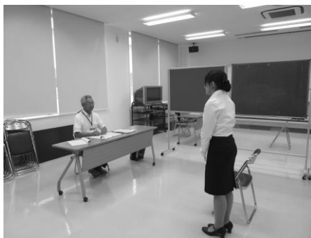
個別模擬面接練習の一コマ

参加者は、実際に就職試験に臨む服装・整容でとても真剣に本講座に取り組んでいました。履歴書の書き方・面接対策など演習の場面も多くあり、参加者それぞれが就職試験を想定し、講座に臨みました。