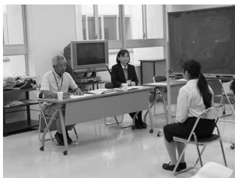
個別模擬面接練習の一コマ