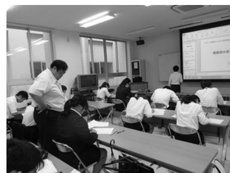
履歴書の書き方練習